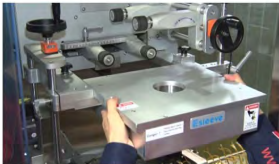
カッターユニットの交換