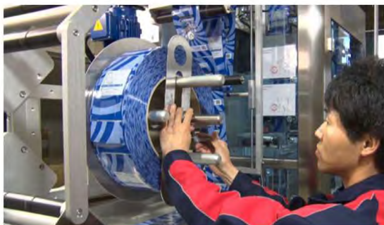
フィルムを前面に配置