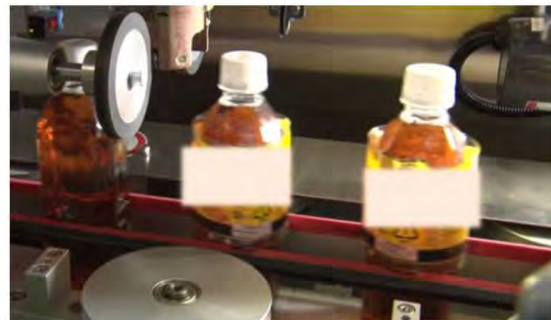
フィルムの間止め